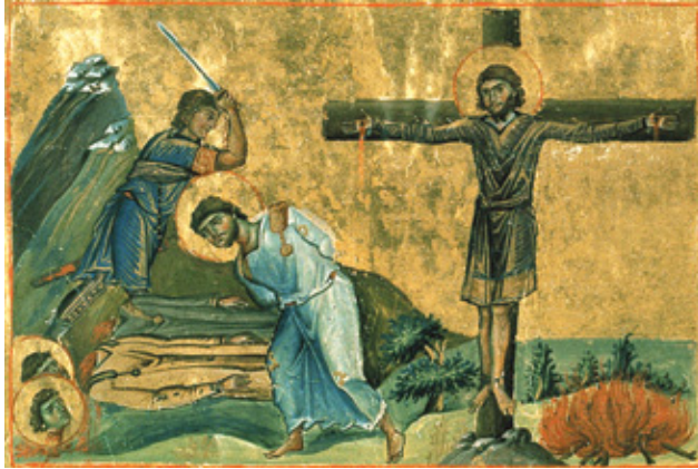
Άθλησις του αγίου μάρτυρος Θεοδώρου του εν Πέργη της Παμφυλίας μαρτυρησαντος Μικρογραφία, Μηνολόγιο Βασιλείου, κώδικας Vaticanus graecus 1613, φ. 55